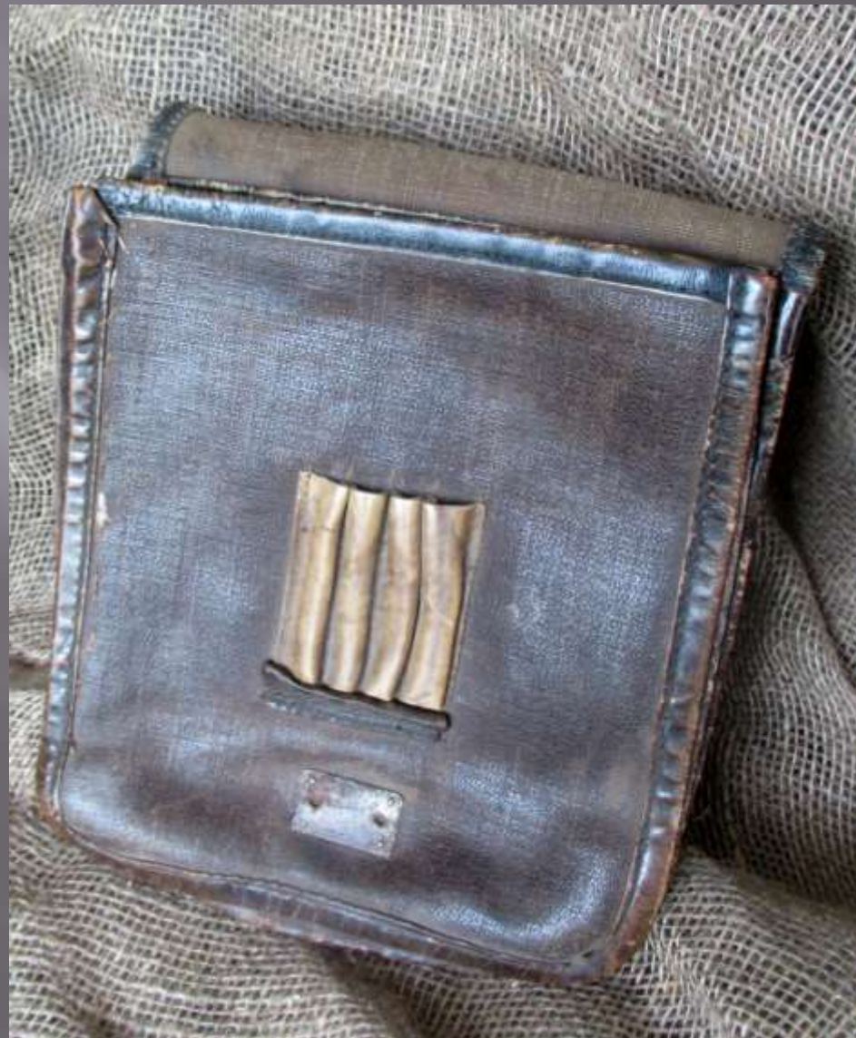
Сумка полевая (планшет)